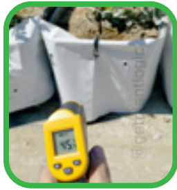
Temperatura de la raíz con Falda de Enfriamiento.