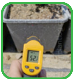
Temperatura de la raíz sin Falda de Enfriamiento.