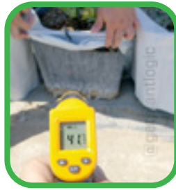
Temperatura de la raíz con Falda de Enfriamiento alzada.